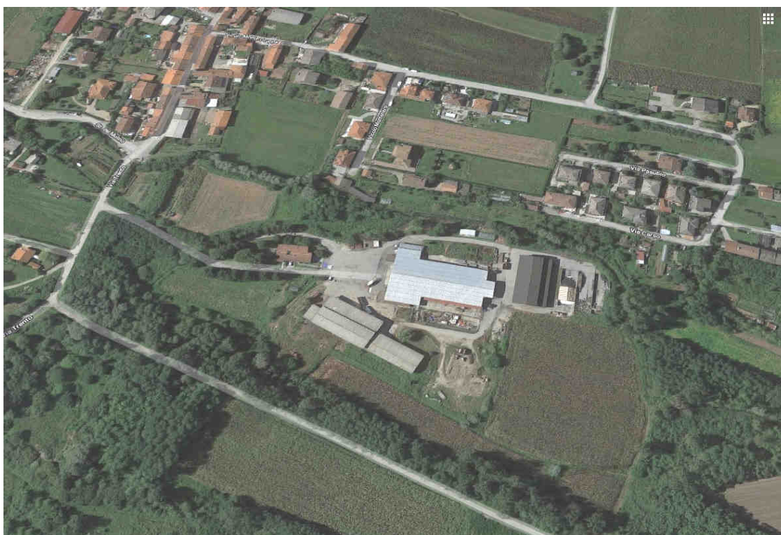
Immagine Google Maps - 3D